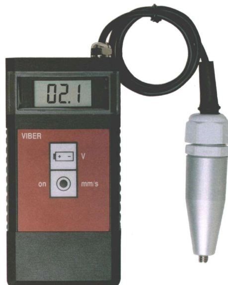
Tipikus digitális rezgésszintmérő kéziműszer (VMI Viber-R)

A tapasztalattal nem rendelkező felhasználóknak javasolható, hogy a mérési eredmények értékeléséhez az ISO 10816-3 szabványt (ez lépett a régi ISO 2372, valamint ISO 3945 helyébe) vegyék alapul. Előfordulnak azonban a szabványnál szigorúbb előírásokat megkövetelő technológiák, valamint a szabványosnál nagyobb rezgésértékeket megengedő esetek is.